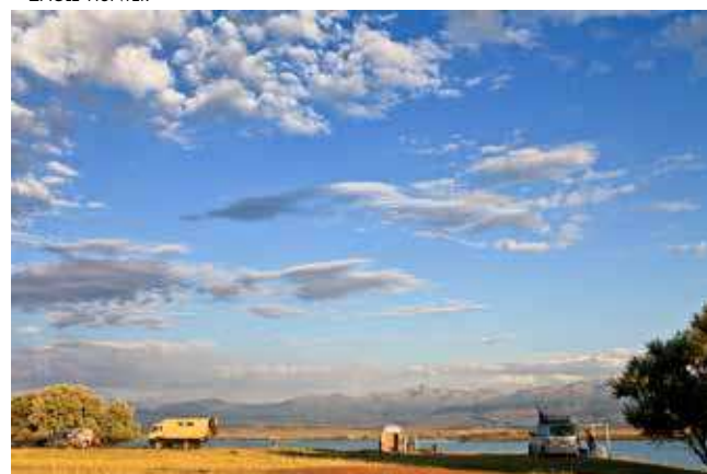
WILDCAMP ISSYK KÖL MET ZICHT OP KUNGEJ ALTOO ~