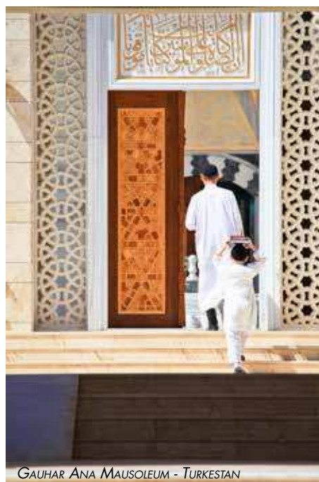
GAUJAR ANA MAUSOLEUM - TURKESTAN