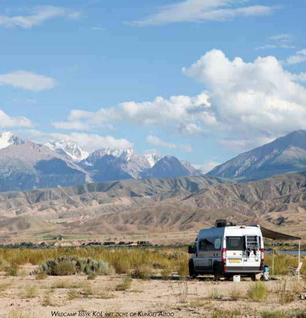
WILDCAMP ISSYK KÖL MET ZICHT OP KUNGEJ ALTOO

40 jaar met zijn arend op dieren. Hij heeft het vak geleerd van zijn grootvader en het kost jaren om de arend zo te trainen dat hij doet wat jij wilt. Met zijn arend loopt de jager een heel eind bij ons vandaan. De prooi, een klein konijntje, wordt door de buurjongen uit een tas gehaald en op de grond gezet. Het beestje blijft verdwaasd zitten en vergeet te rennen. De arend wordt losgelaten, stort zich op het konijntje en binnen een seconde is hij dood. Wij staan er wat ontgoocheld naar te kijken.