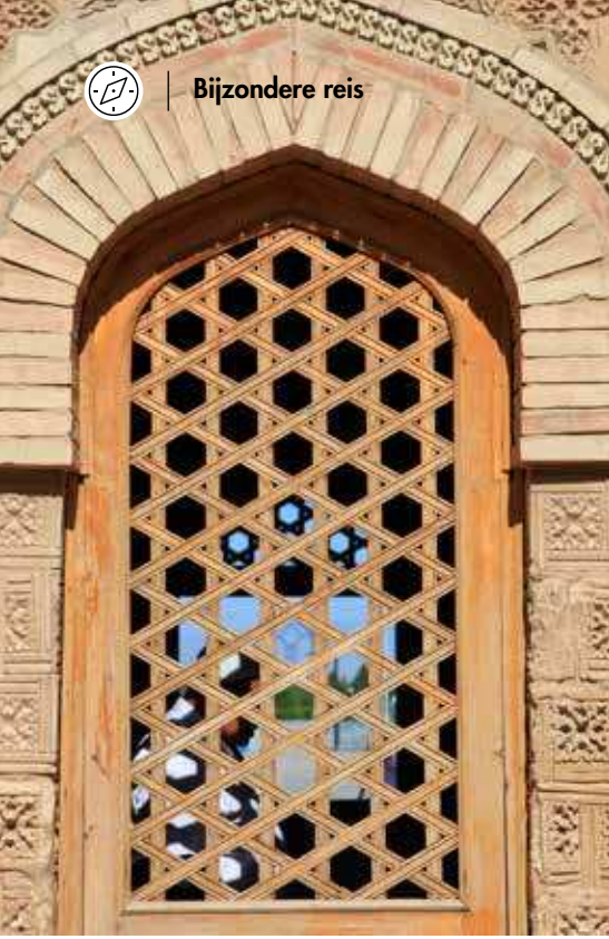
MAUSOLEUM VAN AISHA BIBI – TARAZ

weidsheid en ruimte. Paarden, koeien, schapen en een paar jurts. Midden tussen de Edelweiss en de paardendrollen staan onze campers op deze schitterende vlakte. De afdaling gaat stukken makkelijker. Wij stoppen regelmatig om niets van dit natuurschoon te missen. Zelfs de honderden foto's kunnen niet weergeven wat wij in werkelijkheid zien. Via een goede vierbaanse autoweg komen we bij een hotel, in hartje centrum van Bishkek. Maar niet nadat wij eerst met zijn allen onze jerrycans met diesel hebben gevuld en daarna in grote plastic vuilniszakken hebben verpakt. Nu maar hopen dat de hoeveelheid toereikend is om Oezbekistan door te komen.