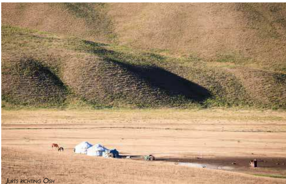
JURTS RICHTING OSH

Lees het verdere verloop van deze reis in het volgende CamperReisMagazine.