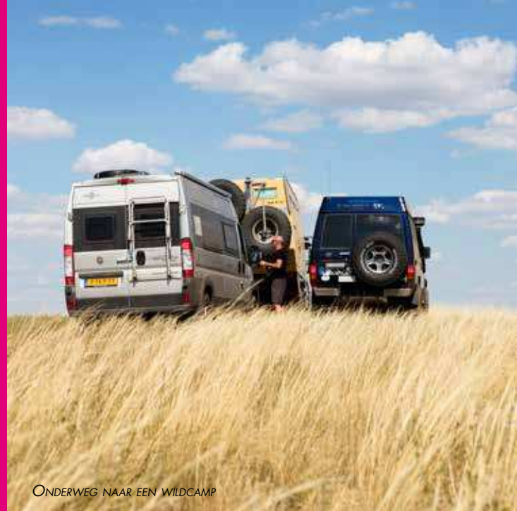
ONDERWEG NAAR EEN WILDCAMP