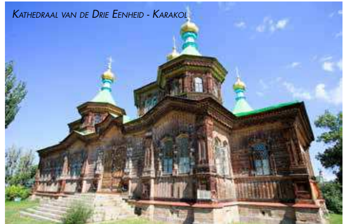
KATHEDRAAL VAN DE DRIE EENHEID - KARAKOL