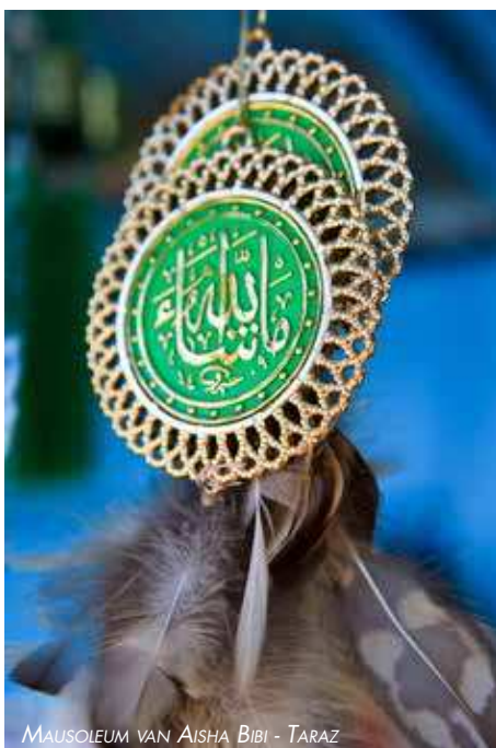
MAUSOLEUM VAN AISHA BIBI - TARAZ

Een land omgeven door hoge bergtoppen van meer dan 7000m met daartussen kraakheldere meren. Meer dan 90% van het grond-