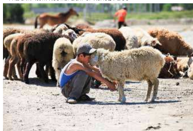
VEEMARKT - KARAKOL ~ ~