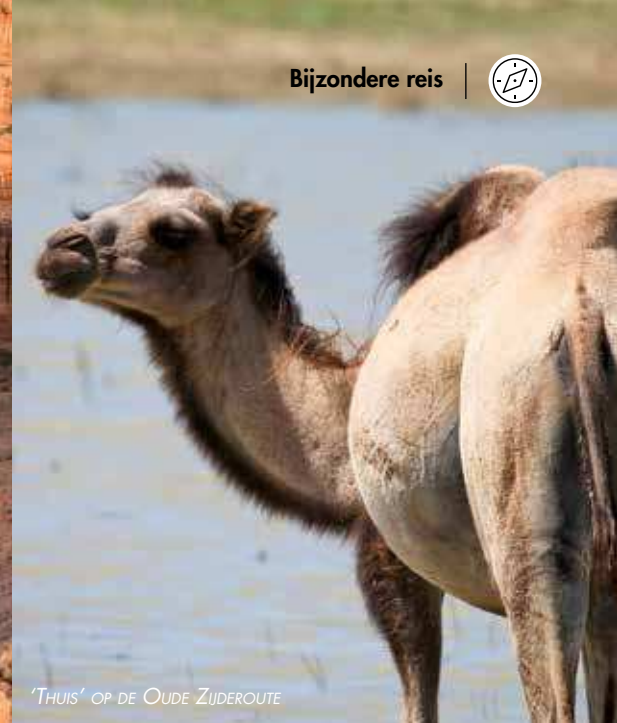
'THUIS' OP DE OUDE ZUIDERROUTE